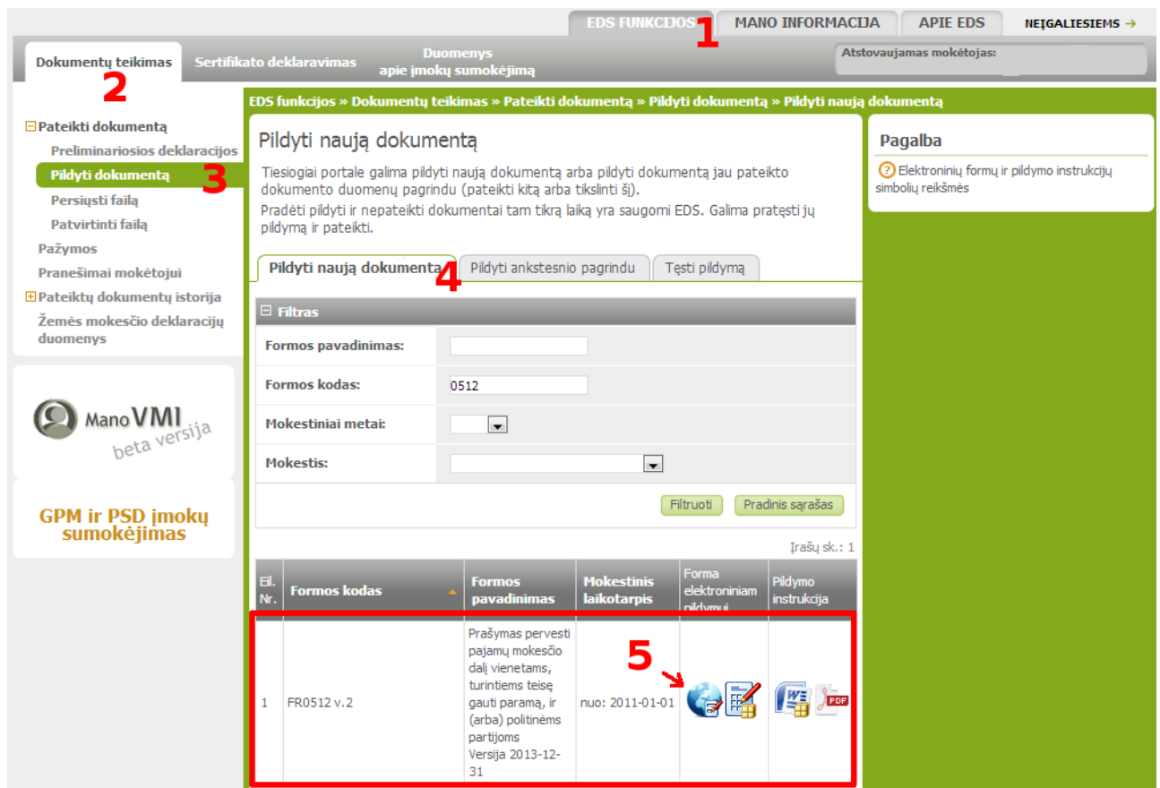
2. pav.: Formos FR0512 v.2 pasirinkimas

Paspauskite Pildyti formą tiesiogiai portale (žr. 3 pav. 5).